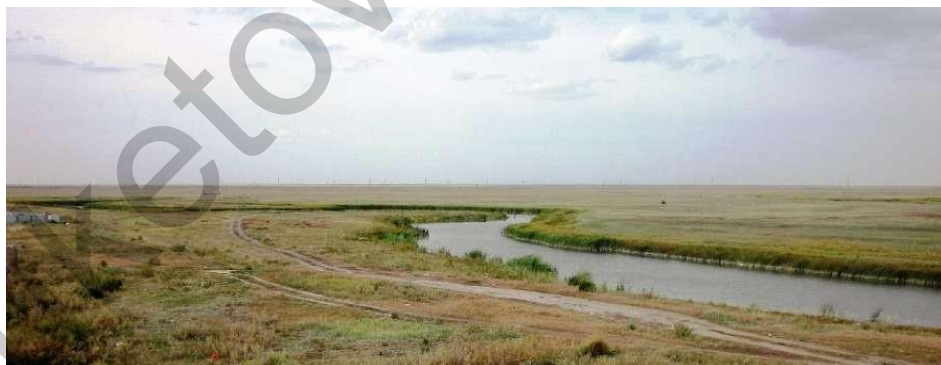
Рисунок 1. Пресноводная старица реки Есиль (Ишим), лишённая ныне поверхностного водопритока и стока в Есиль, в пойменном междуречье рек Нуры и Есиль близ сел. Караоткель – на участке завершающейся перестройки гидрографической сети.

Современная река Нура, бассейн которой равен 60,8 тыс. км 2 , на большей части своего протяжения – к югу от города Астана – по-видимому, представляет собою прежние верховья реки Есиль. К юго-западу от столицы Казахстана, в западной – сниженной части Казахского мелкосопочника (Сарыарка) – налицо редкий феномен завершающегося бокового перехвата реки со стороны Тениз-Коргалжынской впадины (рис. 1). Общая площадь впадины составляет 70 000 км 2 , но наибольшее влияние на изменение гидролого-геоморфологической ситуации оказывает активно погружающееся днище собственно озера Тениз.