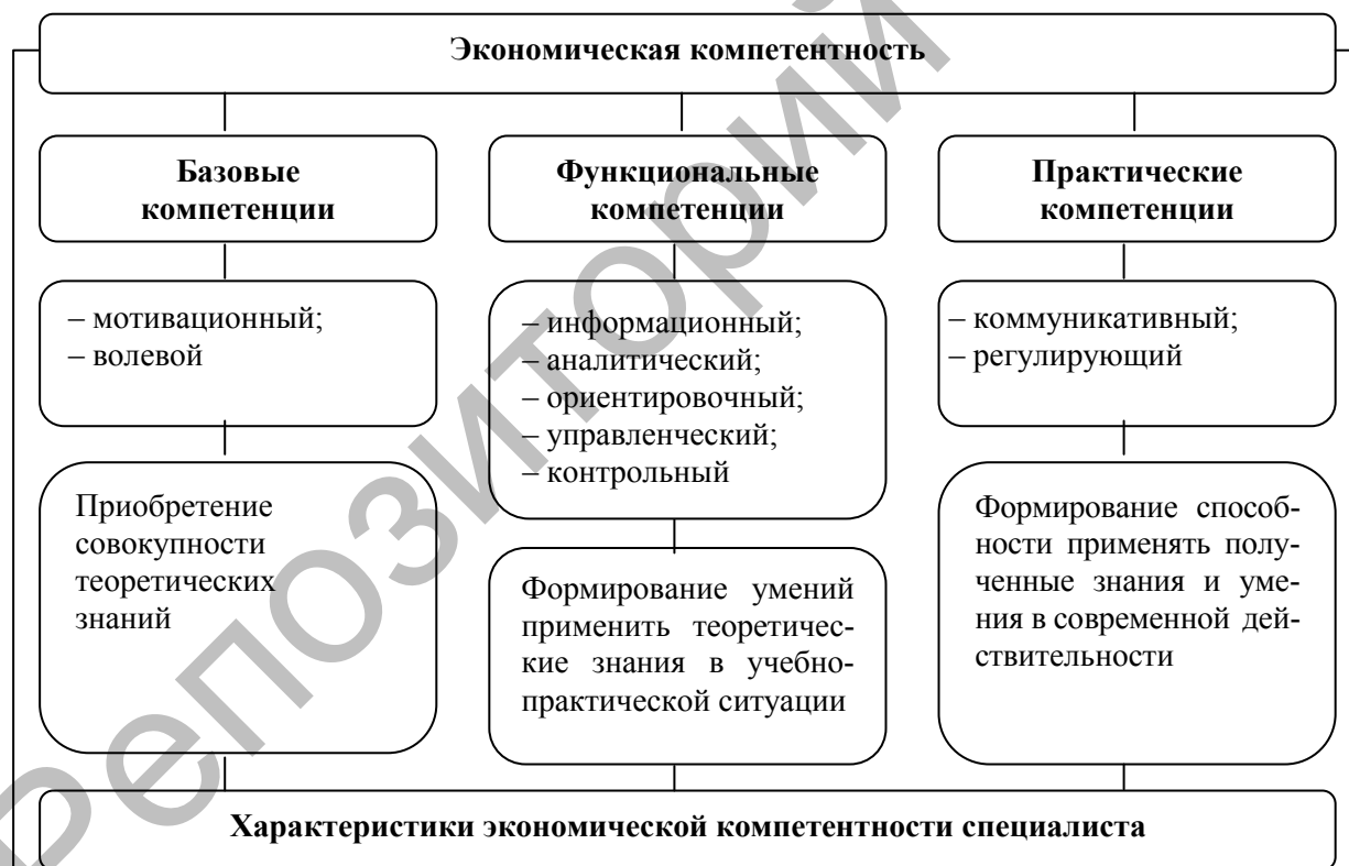
Рисунок 2. Система экономических компетенций специалиста

Наличие этих компетенций позволяет говорить об экономической компетентности специалиста.