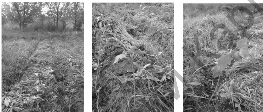
Рисунок 2 - Черенки тополя пирамидального, обработанные ПГУ, через 7 недель после обработки (июль)

Кроме того стоит отметить, что общий визуальный осмотр черенков показал, что общаюблещивленность черенков, которые были подвержены действию ПГУ, выше чем у черенков, которые были подвержены действию гетероауксина.