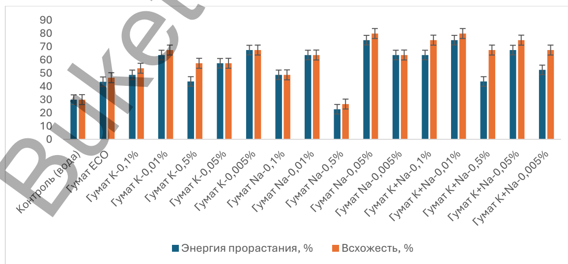
Рисунок 2. Показатели всхожести и энергии прорастания семян пшеницы в зависимости от дозы и концентрации гуминового препарата