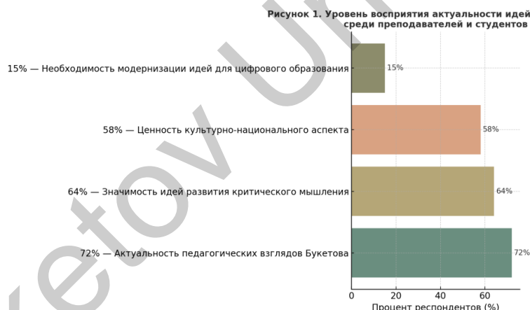
Таблица 1. Уровень восприятия актуальности идей Е.А. Букетова среди преподавателей и студентов (%)

Анализ показал, что наибольшей поддержкой пользуется исследовательский метод (67%). Это объясняется тем, что методология самостоятельного поиска и анализа информации особенно востребована в условиях информационного общества. Междисциплинарные подходы были поддержаны 59% участников исследования, что отражает потребность в интеграции гуманитарных и естественно-научных знаний. Проектное обучение оказалось востребованным у 54% респондентов, особенно среди студентов, которые считают его эффективным для развития практических навыков и навыков командной работы.