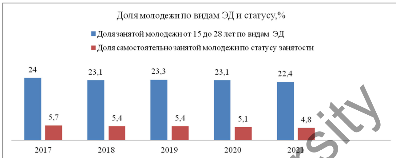
Рисунок 3. Доля молодежи по видам экономической деятельности и статусу занятости, %

На основании данных таблицы 6 сформирована диаграмма, на которой наглядно можно увидеть динамику изменения показателей за последние пять лет (рис. 3).