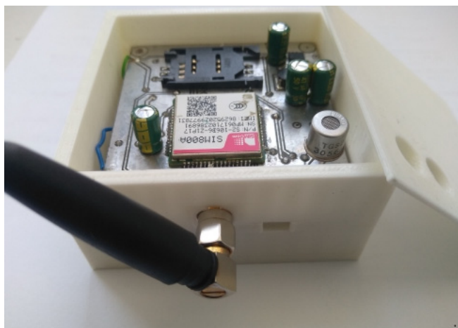
Рисунок 3. Внешний вид разработанного устройства

На рисунке 3 представлено созданное совместно с учащимися устройство.