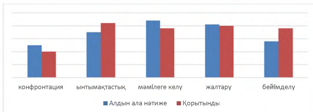
2-диаграмма. Т. Килманнның жанжал жағдайында оқушының мінез-құлық түрін анықтау бойынша диагностикалық зерттеу нәтижелері

Осы әдістемеге сәйкес, біз барлық студенттердің көрсеткіштердің орташа мәнін анықтадық. Біз алған нәтижелер 2-диаграммада көрсетілген.