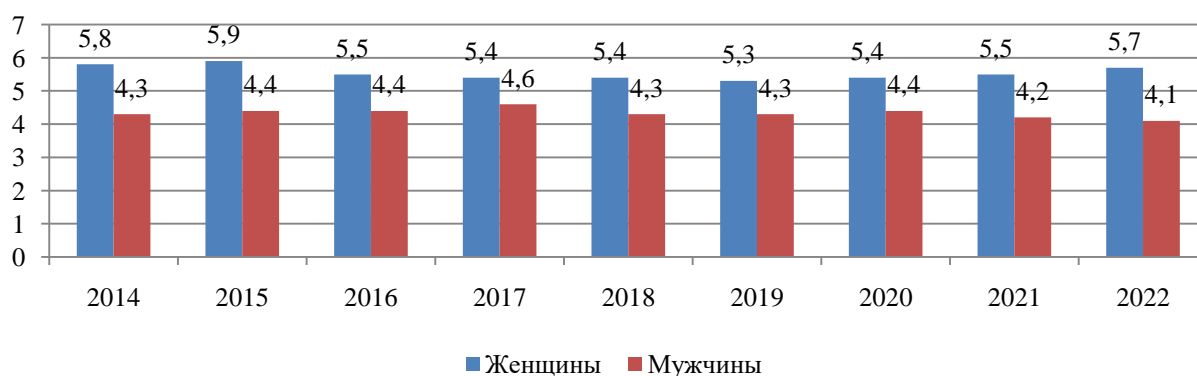
Рисунок 1. Безработица в гендерном разрезе.

П р и м е ч а н и е – Составлено автором по источнику [1]