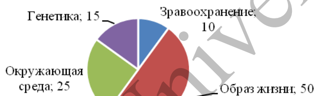
Рисунок 2. Влияние факторов на здоровье человека. %

Следует подчеркнуть, что на здоровье человека система здравоохранения оказывает влияние лишь на 10%, в то время как такие факторы, как образ жизни, окружающая среда и генетика, составляют 50%, 25% и 15% соответственно. Это подчеркивает важность комплексного подхода к улучшению здоровья нации, включая медобслуживание, качество жизни, экологию и образование. Чтобы повысить среднюю продолжительность жизни до 80 лет, Казахстану нужно продолжать развивать эти направления. С 2010 года средняя продолжительность жизни выросла на 2,04 года и в 2022 году составила 71,3 года (данные Всемирного банка). У мужчин она ниже — около 66 лет, у женщин — 76 лет.