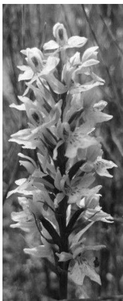
Рисунок 2. Dactylorhiza fuchsii