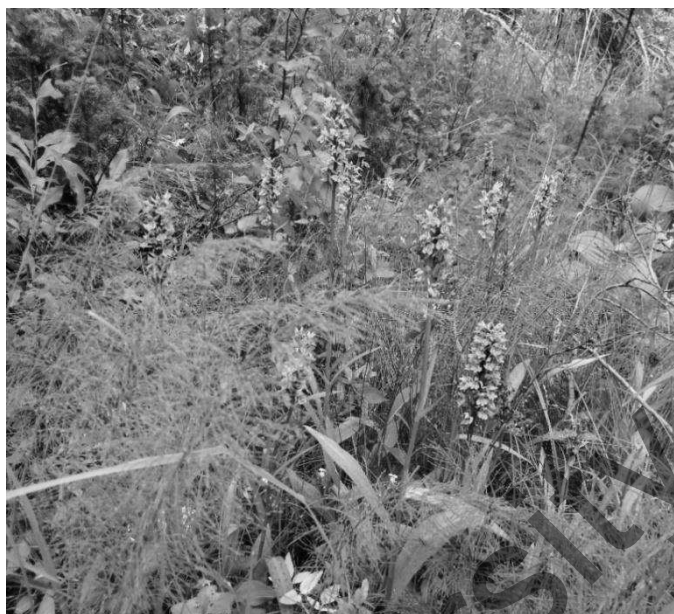
Рисунок 3. Популяция D. fuchsii в период массового цветения

Картирование местонахождений проведено в программе Qgis 3.12.0-București. Категория редкости и статус вида указаны в соответствии с «The IUCN Red List of Threatened Species» [4]. Статистическая обработка результатов проведена в STATISTICA 10.0. Флоро-популяционное сходство исследованных популяций вычислено по формуле Жаккара [16]. Латинские названия даны по WCSP [17] и электронного ресурса The Plant List [18]. Структура семейств указана по системе А.Л. Тахтаджяна [19]. Наименование видов и родов в семействах расположены по алфавиту.