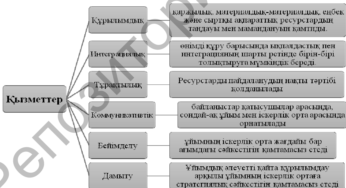
1-сурет. Ұйымдастырушылық әлеуетінің қызметтерінің құрылымы (автормен [2, 3, 9] мәліметтері негізінде әзірленген)

Көптеген ғалымдар ұйымдастырушылық әлеуеттің келесі қызметтерін ұсынады: құрылымдық, интеграциялық, тұрақтылық, коммуникативтік, бейімделу және дамыту (1-сур.).