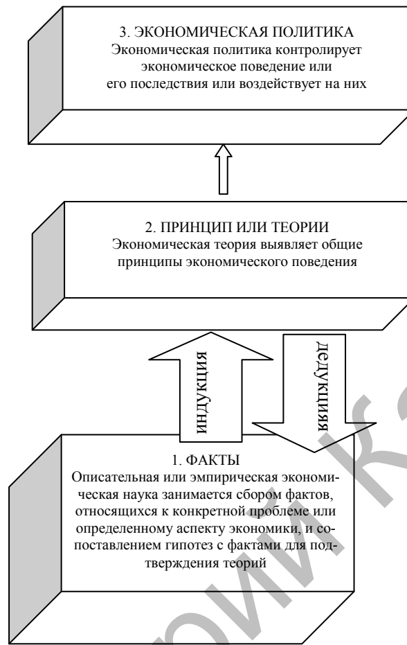
Рисунок 2. Связь между фактами, принципами и политикой в экономике (данные работы [7; 20])

Обычно, приступая к изучению любой проблемы, экономисты должны применять индуктивный метод, собирая, систематизируя и обобщая факты. Используя дедуктивный метод, необходимо выдвигать гипотезы, сопоставлять их с фактами и принимать их как теоретические положения или отвергать, как не согласующиеся с фактами. Полученные таким образом обобщения могут быть полезны для обоснования принятия решений, связанных с деятельностью предприятия (рис. 3).