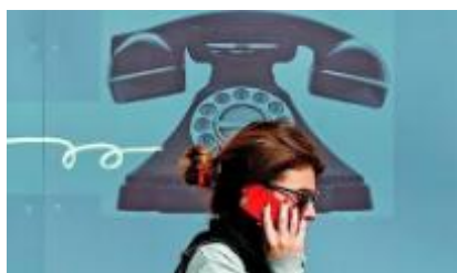
2-сурет. Телефонмен сөйлесу әдебі

1-тапсырма. Телефонмен сөйлесу әдебі туралы білетінімізді ортаға салайық (2-сурет).