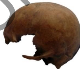
5-сурет. Қалпына келтірілген бас сүйек: алдынан және сол жақ қырынан қарағанда.