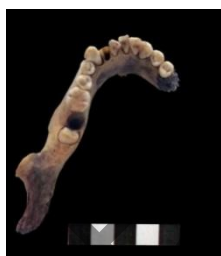
6-сурет. Астыңғы жақ сүйек.

Қалпына келтіруден кейін бас сүйек өлшенбеді. Тістердің тозуы / сырылуы және эктокран жіктеріне қарай (Lovejoy, 1985 бойынша) бас сүйек шамамен 20–25 жас аралығындағы жас әйел адамға тиесілі. Мұндағы 22 жас төменгі 3-азу тістің шығуына байланысты шамалап беріліп отырған уақыт.