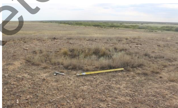
1-сурет. Зерттелген нысанның қазбаға дейінгі көрінісі

2020 жылғы археологиялық қазба жұмыстары Жошы хан кесенесінен солтүстік-шығысқа қарай 900 метр жерде орналасқан (географиялық координаттары 48°09'49.0" ШБ 67°49'19.1" СЕ) аласа төбенің үстіндегі жерлеу орнында жүргізілді. Төбенің үстінде солтүстік-батыстан оңтүстік-шығысқа қарай тізбектеле орналасқан бірнеше жерлеу орнының белгілері байқалады. Жерлеу орындары шағын топырақ үйіндісе ретінде ғана сақталған (1-сурет). Диаметрі 6 м., биіктігі 30–35 см болатын дөңгелек пішінді шағын үйінділердің біріне көлемі 7×7 м қазба салынды.