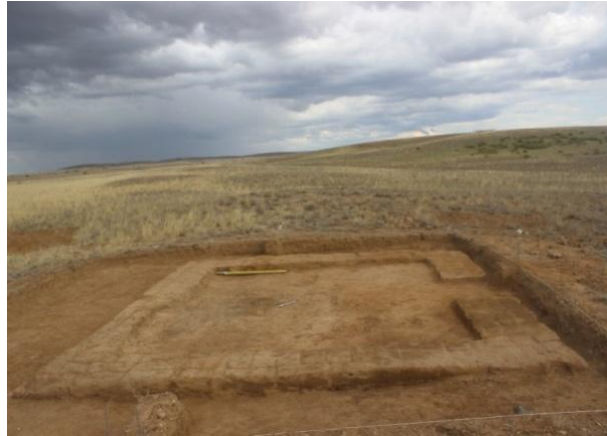
2-сурет. Қазба барысында ашылған құрылыс

Құрылыстың ішін тереңдетіп тазарту барысында, солтүстік бұрышқа жақын жерден ұзындығы 2,4 м, ені 1,2 м қабір шұңқырының ізі байқала бастады. Осы шұңқырды аршу барысында 0,46 м тереңдікте орташа көлемдері 25×25×5 см келетін күйдірілген кірпіш үйіндісі кездесті. Қабірдің үстін жабу үшін арнайы қойылған кірпіштердің ретсіз шашылып жатқанына қарағанда шұңқырдың бұрын ашылғандығын немесе тоналғандығын аңғаруға болады. Одан әрі тазарту барысында 0,8 см тереңдікте қабір шұңқырының ішкі жағын сылаған қалыңдығы 10 см болатын сазды сылақтары мен оның астынан ағаш табыттың қалдықтары ашылды. Ағаш табыт қатты бұзылған, жоғарғы бөліктері әбден шіріген тек астыңғы аз ғана бөліктері сақталған. Шұңқырдан 0,9 м тереңдікте басы солтүстік-батысқа бағытталған жерленген адамның сүйектері аршылды (3-сурет). Адам аяқ-қолдары созылып, қос білегі жамбасының үстіне қойылып, шалқасынан жатқызылған. Адамның оң аяғының тізесінен төмен сүйекке жабысқан былғарының қалдықтары байқалды. Органикалық қалдық қатты шіріп, күлге айналып кеткендіктен сақтап қалу немесе қандайда бір зертханалық талдау жасау мүмкін болмады.