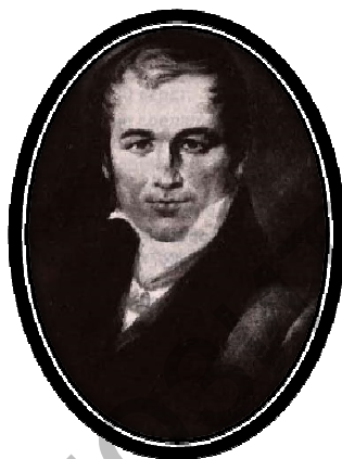
Рис. 11. Г.И. Спасский (1783 – 1864)