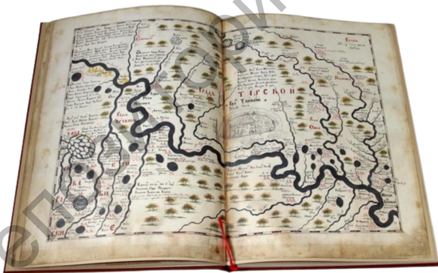
Рис. 1. Чертежная книга Сибири

В настоящее время Казахский Алтай стал объектом пристального изучения не только передовых отечественных учёных, но и зарубежных специалистов. Что в свою очередь позволяет более комплексно изучать край.