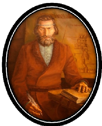
Рис. 2. С.У. Ремезов (1642 – после 1721)