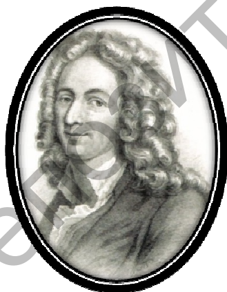
Рис. 7. Л.Д. де ла Кроер (1685 – 1741)