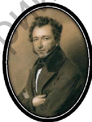
Рис. 12. А.И. Левшин (1798 – 1879)