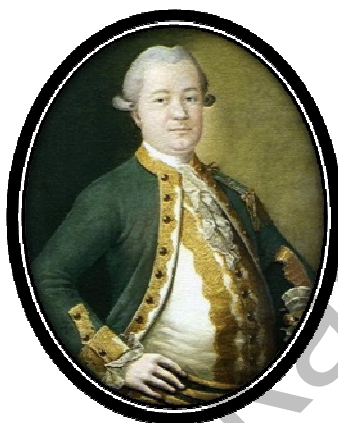
Рис. 10. П.И. Рычков (1712 – 1777)