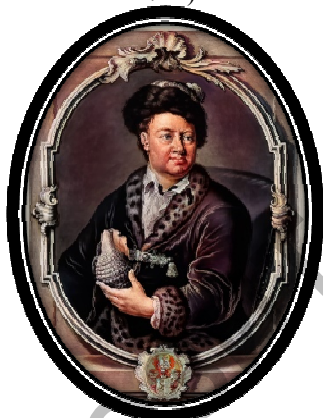
Рис. 4. И.Г. Гмелин (1705 – 1783)