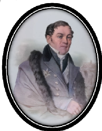
Рис. 8. И.Г. Фишер (1771 – 1853)