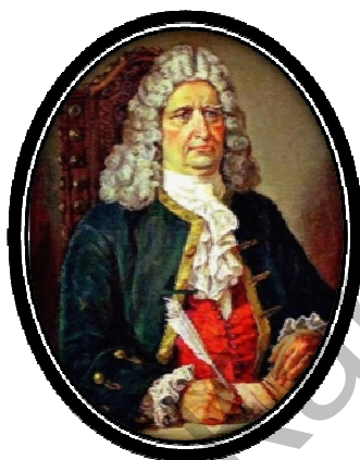
Рис. 3. Г.Ф. Миллер (1741 – 1811)