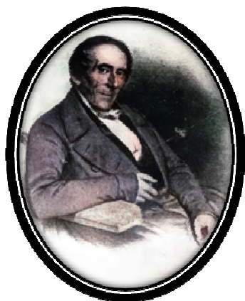
Рис. 13. К.Х. Фридрих фон Ледебур (1785 – 1851)