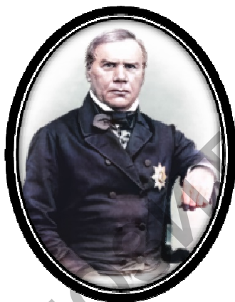
Рис. 15. Э.И. Эйхвальд (1795 – 1876)