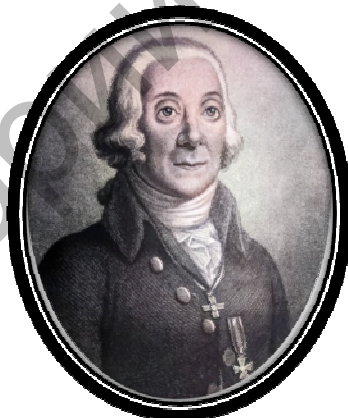
Рис. 5. П.С. Паллас (1709 – 1755)