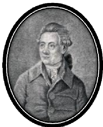
Рис. 9. И.Г. Георги (1729 – 1802)