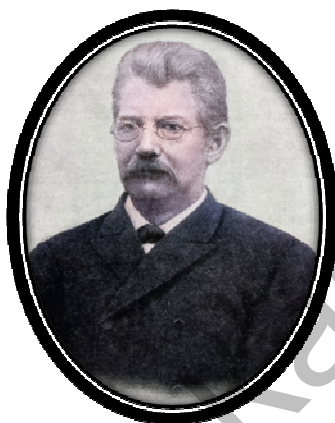
Рис. 14. В.В. Радлов (1837 – 1918)