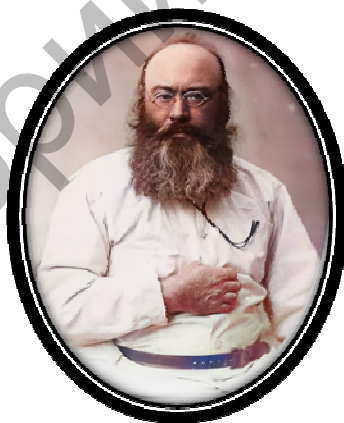
Рис. 16. Е.П. Михаэлис (1841 – 1913)