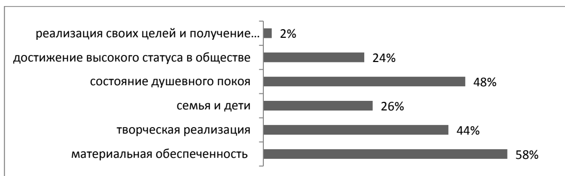
Рис 1. Распределение ответов на вопрос: «В чем Вы видите жизненный успех человека?».

Как уже было сказано, успех это многогранное понятие, которое нельзя рассматривать исключительно через призму материальных ценностей. Понятие «жизненный успех» может включать в себя и ряд нематериальных компонентов. В следующем вопросе мы спросили респондентов о том, в чем они видят жизненный успех. На рисунке 1 мы можем увидеть, что большинство респондентов отмечают, что все-таки материальная обеспеченность является гарантом достижения жизненного успеха – 58%. Однако 48% опрошенных видят жизненный успех также в состоянии душевного спокойствия и 44% отмечают, что творческая реализация также играет ключевую роль в достижении жизненного успеха. Лишь 26% респондентов видят жизненный успех в семье и детях и 24% отметили, что жизненный успех это достижение высокого статуса в обществе.