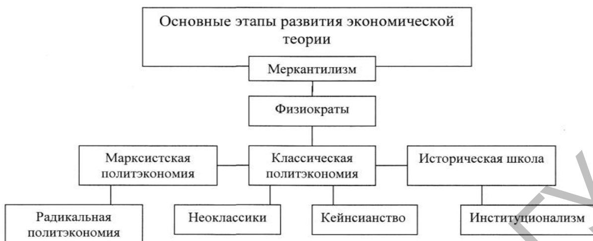
Рисунок 1. Этапы развития экономики

Люди выступают в экономике как потребители, производители и управленцы. И каждый по своему вносит вклад в экономику, как внутри страны, так и за ее пределами. Один человек, находясь в нужное время в нужном месте и занимая высокое положение, может полностью изменить экономику.