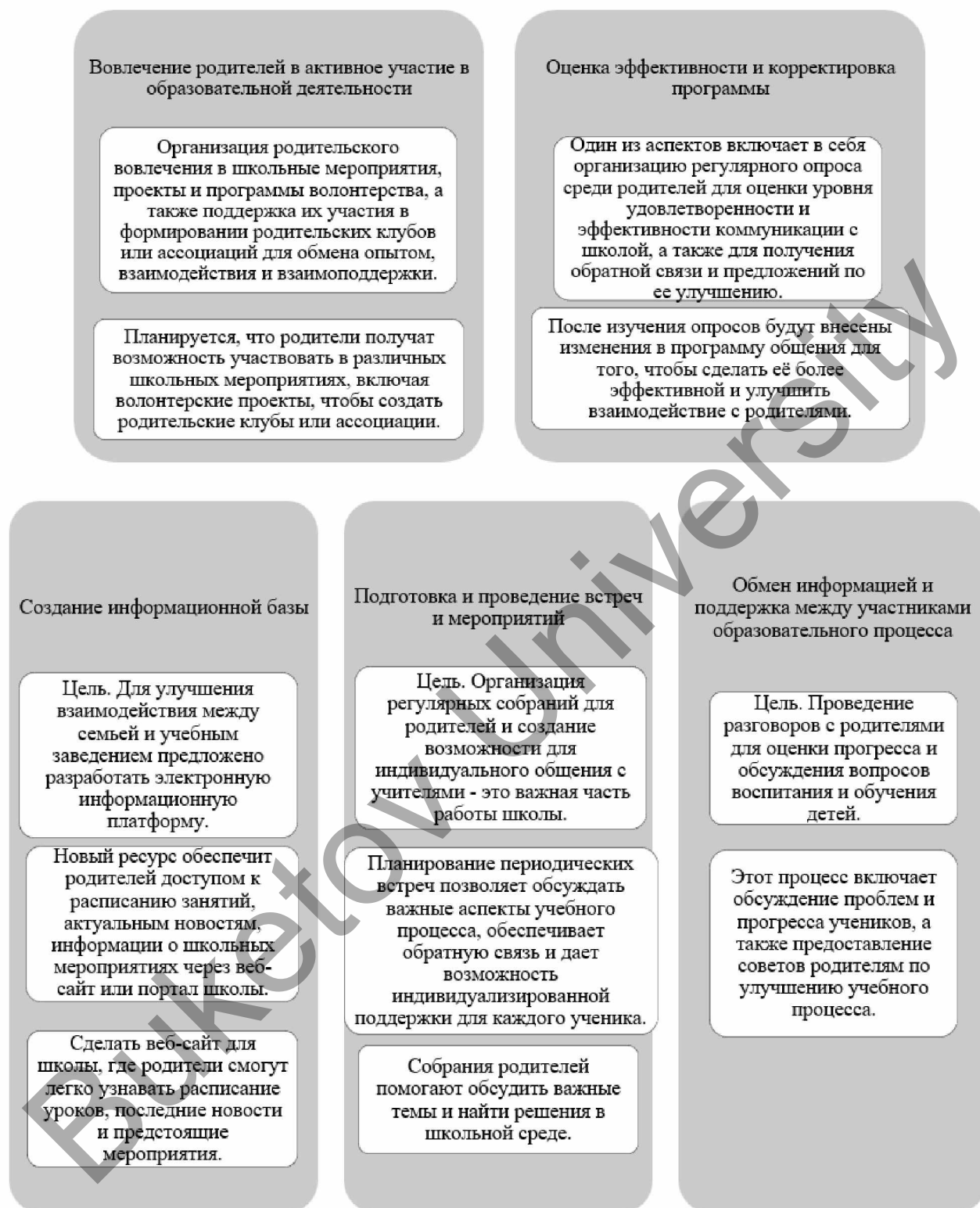
Рисунок 3. Сотрудничество между семьей и образовательным учреждением

Значительное беспокойство вызывает недостаточное осведомление многих родителей о методах воспитания и развития их детей. Раннее детство играет критическую роль в формировании личности и приобретении навыков, которые оказывают влияние на всю последующую жизнь ребенка. Поэтому важно не только привлечь внимание родителей к этому вопросу, но и предложить им конкретные рекомендации и инструменты для улучшения ситуации.