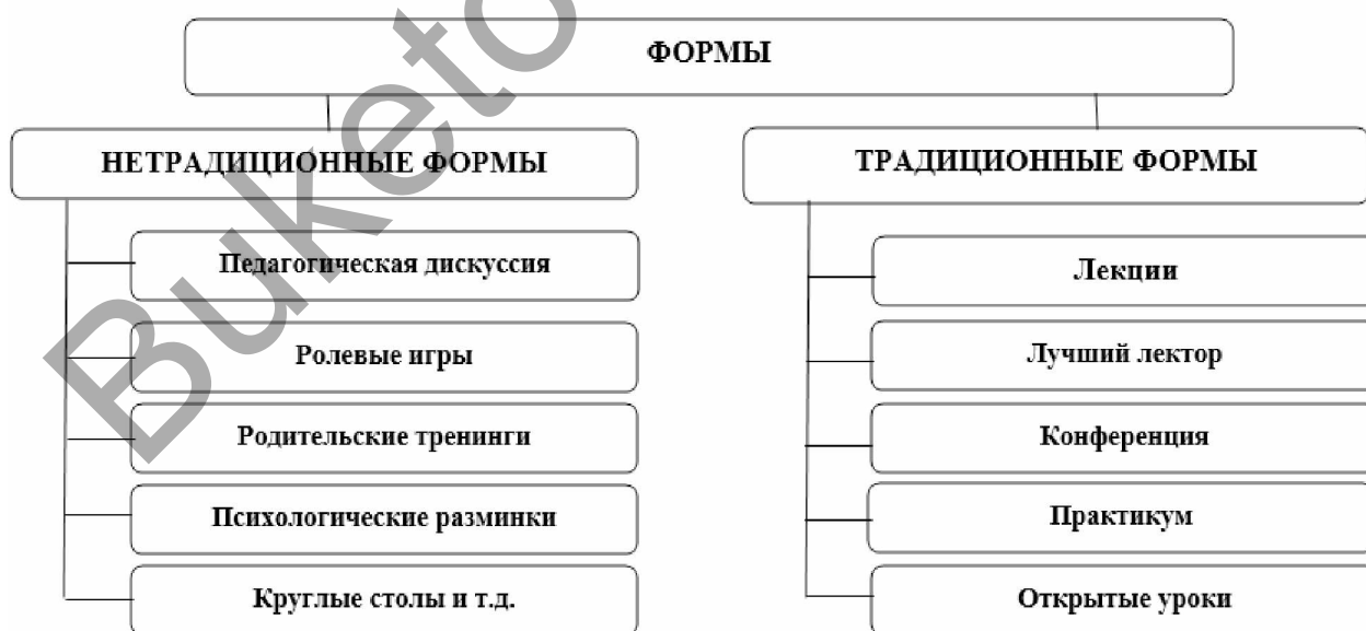
Рисунок 1. Формы работы с родителями

Один из подходов к сотрудничеству между классным руководителем и группой наиболее опытных и активных родителей состоит в организации классного родительского комитета. Под руководством классного руководителя этот комитет совместно разрабатывает и реализует коллективные инициативы в области педагогического образования, поддерживает контакты с родителями, оказывает помощь в воспитании учеников, организует совместные досуговые мероприятия и проводит анализ, оценку и обобщение результатов (рис. 1) [7; 729].