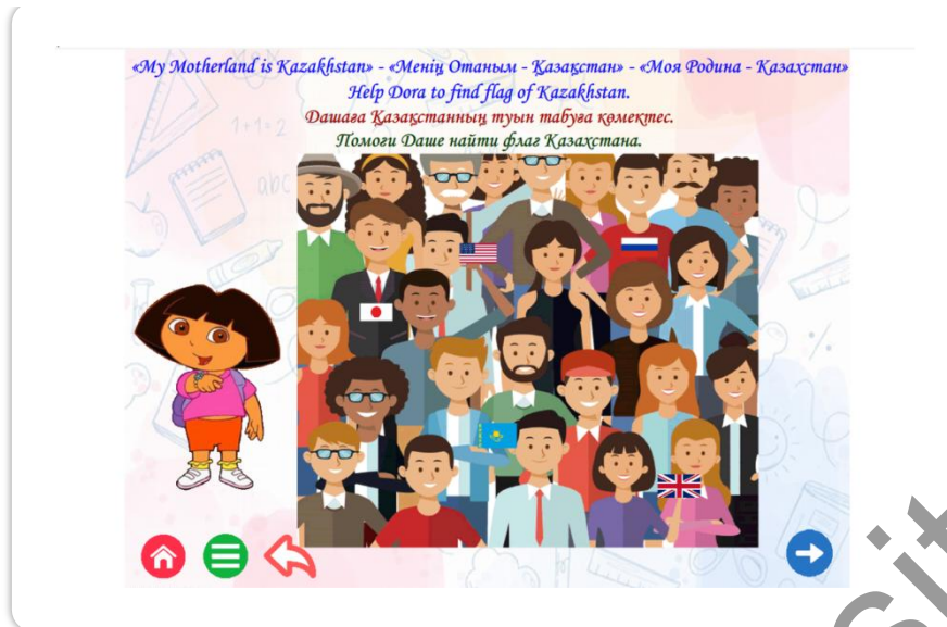
Сурет 2. 1 сынып оқушыларына арналған интерактивті тапсырмалар жинағының бас кейіпкері

Бұл анимациялық сериалдың кейіпкері ағылшын, орыс және қазақ тілдерінде сөйлейді, бұл біздің ойымызша, балалардың тек ағылшын тілін ғана емес, ана тілін (қазақ немесе орыс тілін) үйренуге деген қызығушылығын арттырады [6]. Осы мақсатта интерактивті тапсырмалар жиынтығындағы барлық тапсырмалар үш тілде берілген. Интерактивті тапсырмалар жиынтығы Интернетке қосылусыз, кез келген гаджеттен іске қосылады.