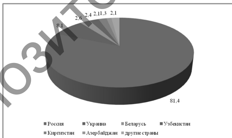
Рисунок 4. Структура обслуженных посетителей объектами размещения по странам в 2014 г., % (данные работы [6])

Согласно данным рисунка 4 в 2014 г. структура туристских прибытий по странам происхождения характеризовалась следующими показателями: 81,4% посетителей из Российской Федерации, 8,1% — из Украины, 2,6% — из Беларуси, 2,4% — из Узбекистана, 2,1% — из Киргизстана, 1,3% — из Азербайджана и 2,1% — из других стран.