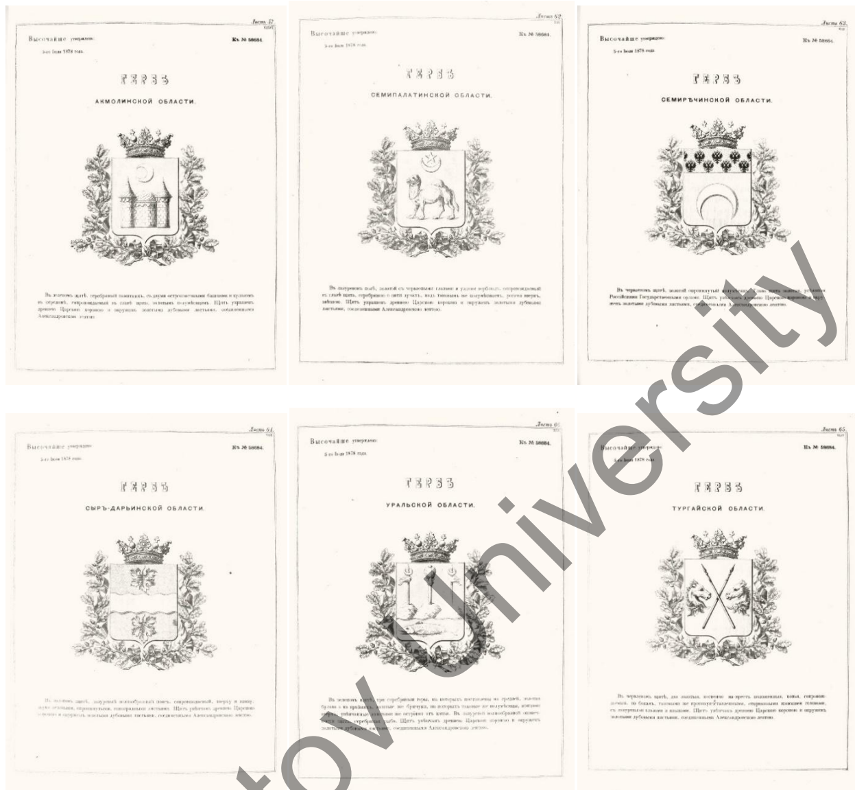
Сурет 1. Ақмола, Семей, Жетісу, Сырдария, Торғай және Орал облыстарының елтаңбалары

Қала тұрғындардың жаңа қызмет түрлерін ғана қалыптастырып қоймайды, сонымен қатар жаңа типтегі адам — қала тұрғынын жасап шығарады. Қала өз тұрғынына өндірістік қызметтің бұрын таныс емес түрлерін игеру — еңбек операцияларын бөлу, мамандану талаптарын қояды. Олардың арасындағы байланыс тауар-ақша қатынастары негізінде жүзеге асады. Адам қалалық ортада әрі өндіруші, әрі тұтынушы ретінде көптеген рольдерге түседі.