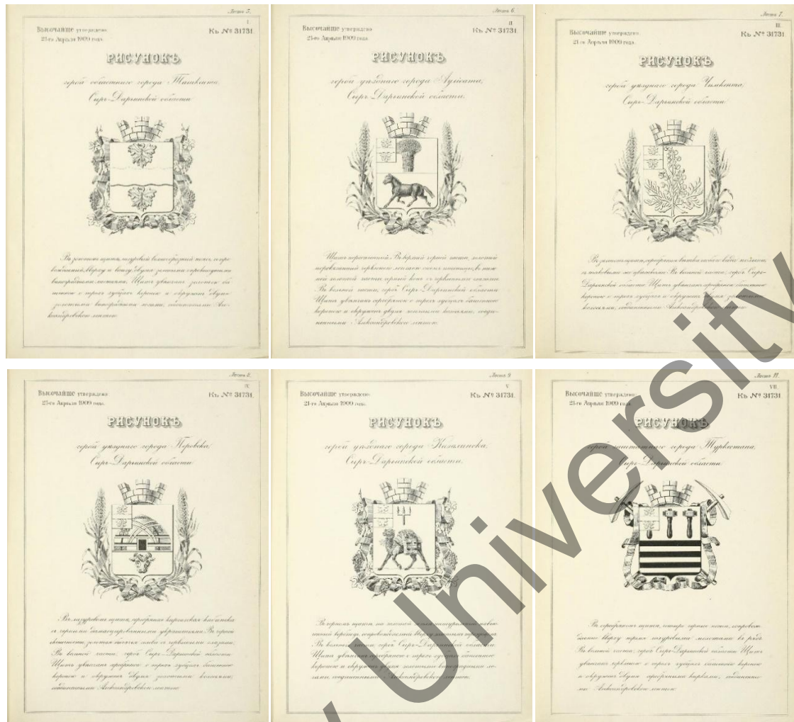
Сурет 2. Ташкент, Перовск, Қазань, Петро-Александровск, Түркістан қалаларының елтаңбалары

Қалалық процестердің даму заңдылықтары, оны жабық жүйе ретінде, тек қаланың өзін ғана емес, сонымен қатар оның жалпы бүкіл қоғамның даму процестеріне әсер етуші жүйе ретіндегі әрекетін сипаттайды. Бұл жүйе өз кезегінде жаңа қажеттіліктерді талап етеді, адам оларды қанағаттандырудың мүмкіндіктерін іздей отырып, жаңа өнімдерді, сонымен бірге жаңа байланыс, коммуникация жолдарын да іздеп табады. Сауда, өндірістің дамуы көлік тасымалының керуен жолымен қатар, су жолы және темір жолына қосылуды туындатты. Темір жол да, су жолы да тек тауар ғана емес, адам тасымалы, шаруалардың қоныстануымен байланысты жүрді (сурет 3).