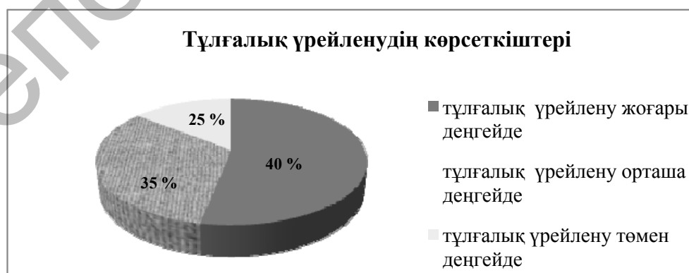
1-сурет. Ч.Д.Спилбергер мен Ю.Л.Ханиннің үрейленуді анықтауға арналған сұрақнамасы бойынша тұлғалық үрейленудің көрсеткіштері

Әдістеменің негізінде алынған нәтижелерді тұлғалық және жағдайлық үрейлену бойынша жеке-жеке есептедік. Әдістемеге сәйкес, жағдайлық үрейлену ретінде студенттердің жоғарғы оқу орнындағы жаңа оқу жағдайына бейімделу жағдайын алдық. Алынған сандық көрсеткіштердің сапалық талдауына келетін болсақ, тұлғалық үрейлену шкаласына байланысты үш деңгей анықталды: 25 % сыналұшылардың бойында бұл жоғары деңгейде, 35 % сыналұшыларда орташа деңгейде, 40 % сыналұшыларда төмен деңгейде екендігі анықталды. Тұлғалық үрейлену шкаласы, адамның тұрақты жеке сипаттамасын білдіреді. Көрсеткіштерді 1-суреттен көруге болады.