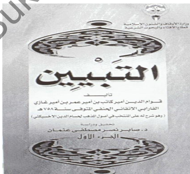
Рис. 3. Обложка комментария Кауам ад-дина к «Аль-Хидайя».

«Аль-Хидайя» является очень важным трудом в мусульманском мире, ведь этот сборник являлся опорой мусульманского права и использовался во многих странах Средней Азии вплоть до введения Советской судебной системы [4, с. 12]. Комментарий Кауам ад-дина (см. рис. 3) под названием «Конечная цель разьяснения и достижения эпохи» также оказал влияние на исламскую культуру.