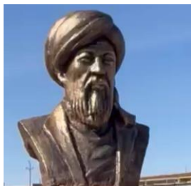
Рис. 1. Скульптура Кауам ад-дина в мечети Икана.

Кауам ад-дин аль-Иткани аль-Фараби ат-Туркестани (см. рис.1) в 1286 году в городище Старый Икан, вблизи Туркестана. Настоящее имя Кауам ад-дина - Лутфулла. Его кунья - Абу Ханифа, а прозвище - Кауам ад-дин. Также его называли Амир Катиб, что в переводе означает «знатный писец». Его отца звали Амир Умар аль-Амид, а деда - аль-Амид Амир Гази. В источниках его имя встречается в разных вариациях: «Кауам ад-дин Амир Катиб бин Амир Умар аль-Иткани», «Кауам ад-дин Абу Ханифа», «Амир Катиб Аби Мухаммад бин Гази аль-Иткани ат-Туркестани». Как писал профессор А.Дербисали в своем труде «Звезды казахской степи»: «...первое образование получил на родине, а затем преподавал в одном из медресе Икана...» [1, с. 141]. Известно, что он овладел практически в совершенстве арабским языком именно на Родине. Оставался в казахских степях вплоть до 31 года, пока не усовершенствовал свои знания. В это время он работал имамом в мечети. В городах Средней Азии, таких как Ахси, Насаф, Мары, Ургенч, Хива располагались центры исламской культуры. Кауам-ад-дин слушал и изучал лекции ученых из этих городов. Предположительно, это одна из причин, почему он оставался на Родине до 1317 года.