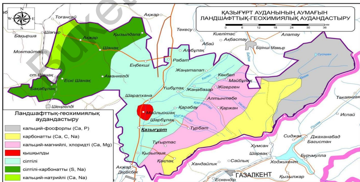
3-сурет. Қазығұрт ауданының аумағын ландшафттық-геохимиялық аудандастыру картасы

Қазығұрт ауданы аумағын ландшафттық-геохимиялық аудандастыру кезінде аса ескерілген тағы бір критерий — тұздылық пен минералдылық мәндері, яғни зертханалық талдау жұмысының нәтижелері бойынша аудандастыру жүргізілді.