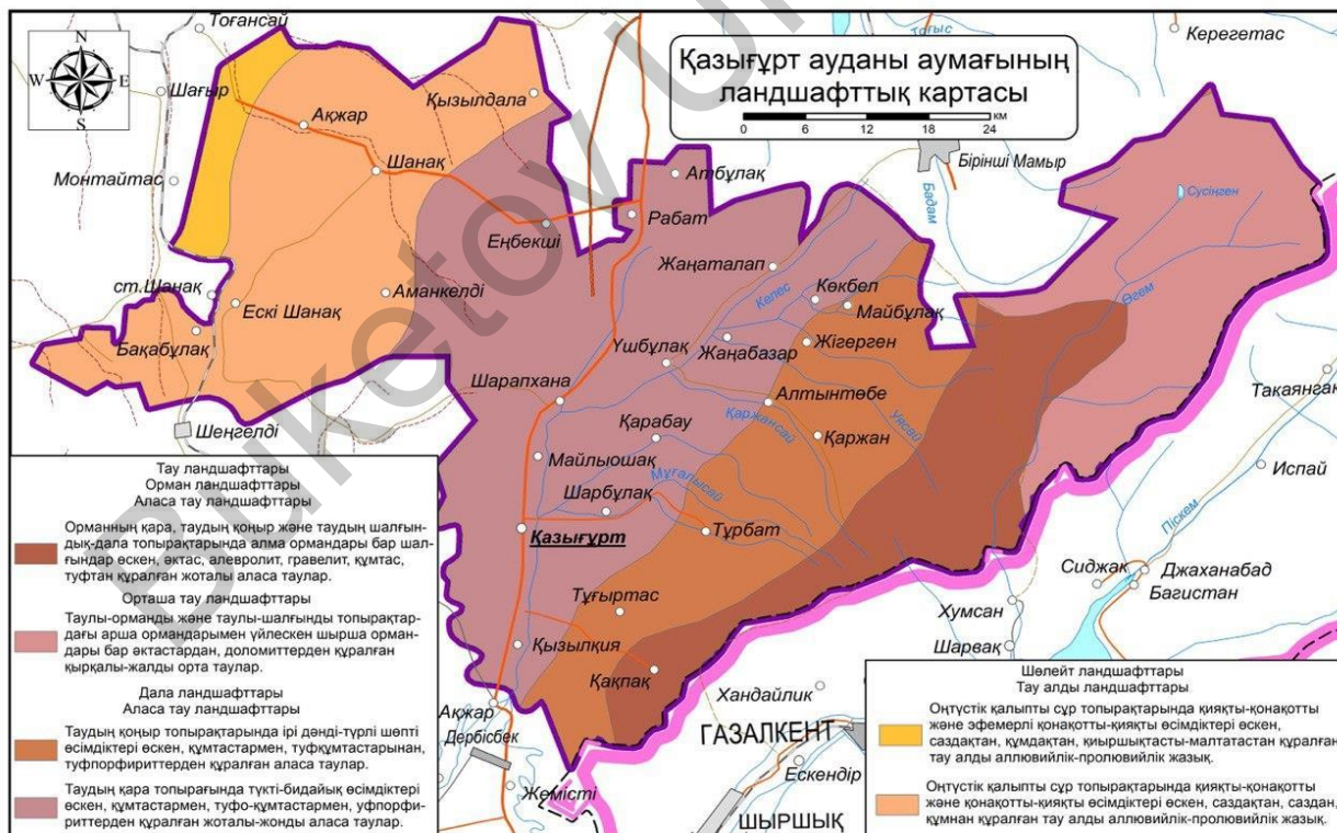
2-сурет. Қазығұрт ауданының ландшафттық картасы

Қазығұрт ауданының ландшафттық картасы — Қазақстанның ландшафттық картасының масштабын ұлғайту арқылы жасалынды. Ландшафттық карта масштабы — сызықтық масштаб түрінде көрсетілді. Картаның өзіне мән берсек, Қазығұрт ауданы аумағын тау ландшафттары, оның ішінде аласа, орташа тау мен орман ландшафттары, дала оның ішінде аласа тау ландшафттары және шөлейт пен тау алды ландшафттары алып жатыр. Қазығұрт ауданы аумағының көп бөлігін дала ландшафттары оның ішінде аласа тау ландшафттары алып жатса, ал керісінше өте аз бөлігін шөлейт ландшафттары алып жатқанын байқауға болады (2-сурет). Айта кететін жағдай, Қазығұрт ауданының аумағын ландшафттық-геохимиялық аудандастыру картасы — Қазығұрт ауданы ландшафттық картасы көмегімен жасалынды.