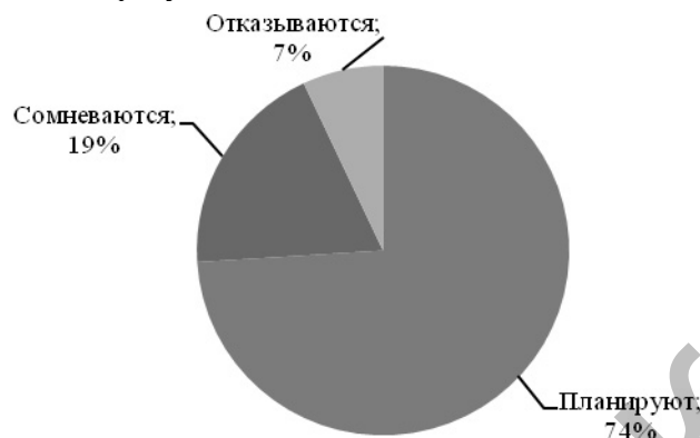
Рисунок 1. Отношение населения к участию ВПН–2020

Также на сайте представлены результаты отношения к переписи, которые тщательно собирались и анализировались, и показаны на рисунке 1.