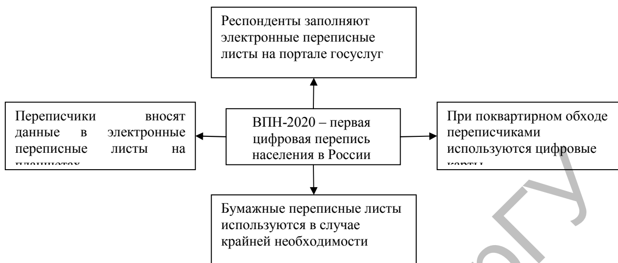
Рисунок 2. Форматы проведения переписи ВПН-2020