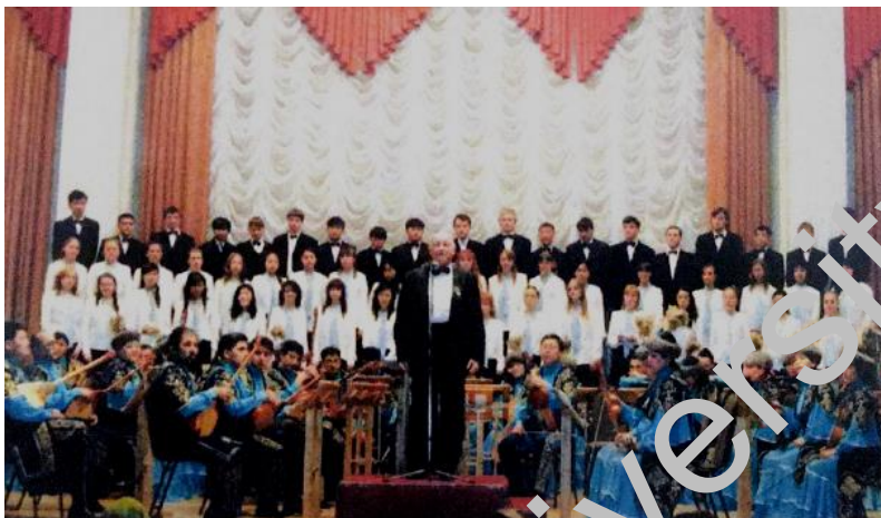
Фото 5 – Выступление хора колледжа искусств с оркестром казахских народных инструментов им. Таттимбета. Концертный зал «Шалкымы», 2000-е годы