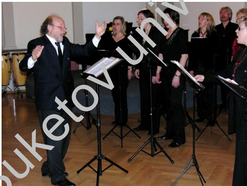
Фото 12 – «Kammerchor Waldemar Schiller». Дирижер – В.Э. Шиллер. Германия, 2006 год [10]