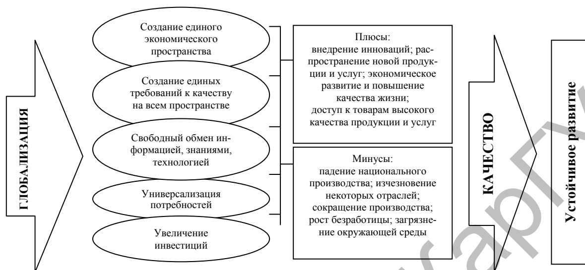
Рисунок 1. Использование методов управления качеством в инновационном развитии и решении социально-экономических проблем

нию международной конкуренции, что не может не вызвать роста производства как на национальном, так и на мировом уровне.