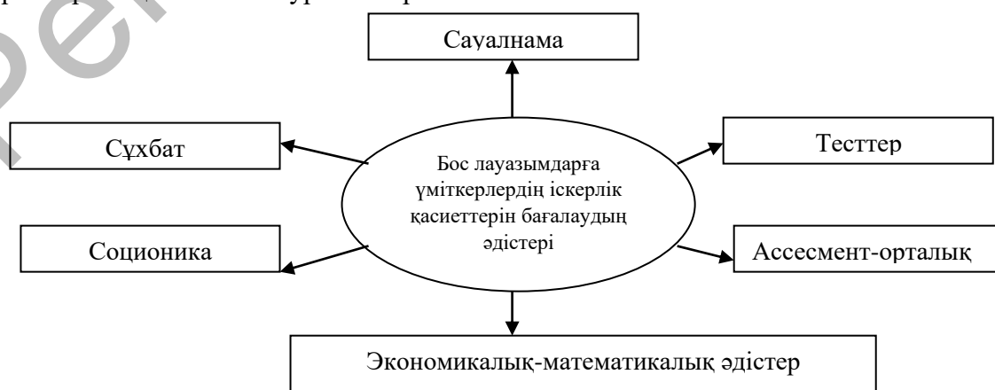
Сурет 2. Бос лауазымдарға үміткерлердің іскерлік қасиеттерін бағалаудың негізгі әдістері

2. Бос лауазымдарға үміткерлердің іскерлік қасиеттерін бағалаудың негізгі әдістерін қарастырайық. Ол келесі суретте көрсетілген.