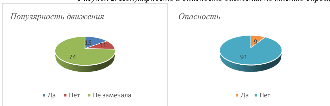
Рисунок 2. Популярность и опасность движения по мнению опрошенных

9% считают идеологию чайлдфри опасной для общества. Самыми распространенными ответами на вопрос «Почему Вы так считаете?» были: