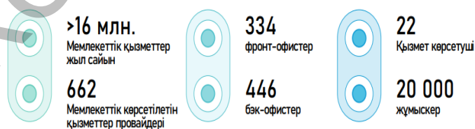
Сурет 2. «Мемлекеттік корпорация» платформасындағы қызметтер, 2022

Жалпы, 2022 жылы Электронды Үкімет платформасында келесі қызметтер орындалды. Ол толығымен келесі суретте 2 көрсетілген.