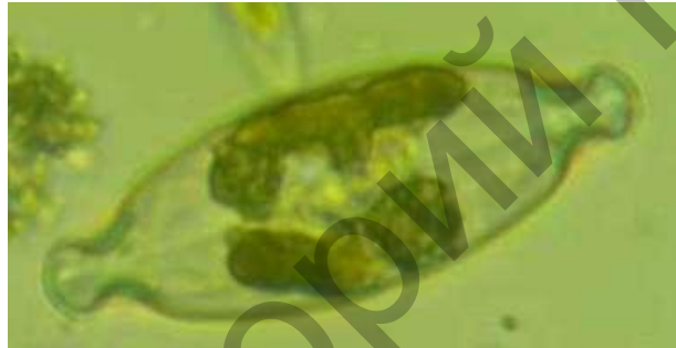
Рисунок 1 - Caloneis amphisbaena ( \times 160 ).

Виды Caloneis встречаются в бентосе пресных и солоноватых водоемов.