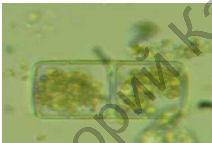
Рисунок 3 - Melosira varians ( \times 160 ).

Виды Melosira встречаются в планктоне и бентосе пресных водоемов и морей. Питается фототрофно, размножается продольным делением клеток. Может вызывать «цветение» воды.