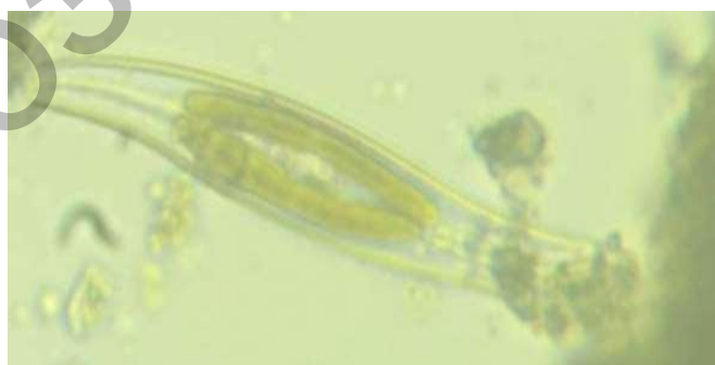
Рисунок 4 - Pleurosigma salinarum ( \times 160 ).

Клетки Pleurosigma salinarum имеют S-образную форму (рис. 4).