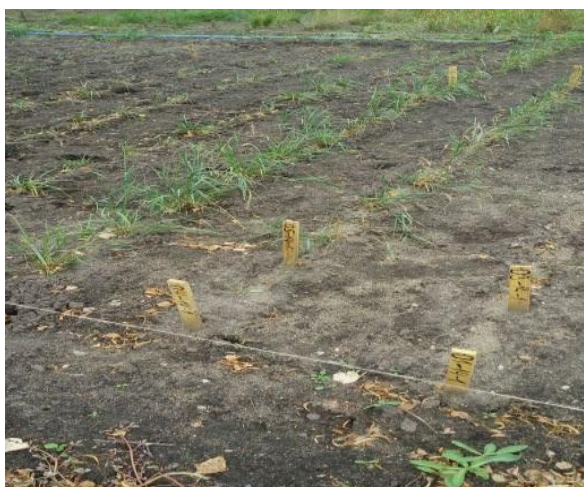
Рисунок 1. Фрагмент экспериментального участка Agropyron pectinatum . Начало выхода в трубку

температура воздуха достигала +5,5\text{ }^{\circ}\text{C} , а почва прогревалась до 0,5\text{ }^{\circ}\text{C} на глубину до 12 см. Ежегодно проводившаяся весенняя инвентаризация посевов показала отсутствие выпадов опытных растений в период перезимовок. Выход в трубку отмечен с 23.05 по 10.06 (рис. 1). Первыми в фазу колошения в последних числах мая (28.05–31.05.) вступали образцы, выращенные из семян житняково-люцерновых и ковыльно-полынно-житняковых ассоциаций, затем из кустарниково-житняковых и горно-кустарниково-полынно-житняковых ассоциаций (03.06–05.06). Фаза колошения образцов, выращенных из семян с юго-восточного предгорья гор Коктау (караганово-разнотравно-злаково-луговые ассоциации) проходила с 10.06 по 14.06. Наблюдения в течение 4-х вегетационных сезонов показали, что у всех образцов в культуре колошение дружное и короткое, продолжительность этой фазы развития составила 5–7 дней. Начало цветения — конец июня с 25.06–29.06, массовое цветение — первая декада июля с продолжительностью 2–3 дня. Семена созревали со второй декады августа, завершая этот процесс в середине третьей декады месяца. К завершению созревания семян наблюдалась массовая осенняя генерация листьев (рис. 2).