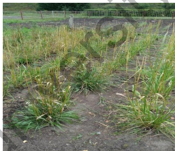
Рисунок 2. Фрагмент экспериментального участка Agropyron pectinatum . Осенняя генерация листьев

Таким образом, в результате изучения сезонного ритма развития было установлено, что все опытные посевы A.pectinatum в условиях Алтайского ботанического сада оказались зимостойкими с полным циклом сезонного развития, завершая его семеношением, по срокам цветения — среднецветущими.