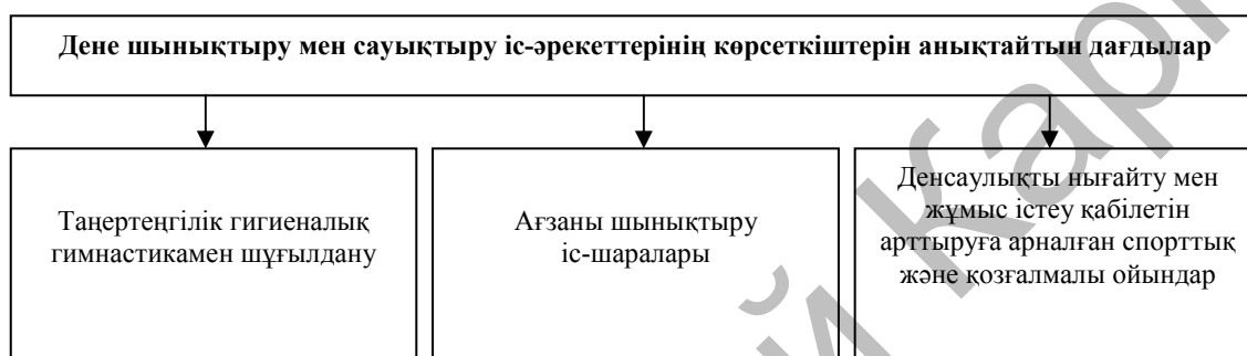
2-сурет. Ағзаны шынықтыру және сауықтыруға ықпал ететін негізгі дағдылар

Спорттық іс-әрекеттер дағдыларын игеру деңгейлерін бағалау үшін нормативтік құжаттар мен осы мәселе бойынша басылып шыққан материалдарды, басылымдарды қолданады. Онда мынадай бөлімдерді бөліп көрсетуге болады: «Бір-екі спорт түрінен негізгі ережелерді білу», «Бір-екі спорт түрінен негізгі техникалық әдіс-тәсілдерді білу», «Бір-екі спорт түрінен еліміздің чемпиондарын білу», «Спорттың бір түрінен жарысқа қатысу», «Спорттың бір түрінен спорт үйірмесіне қатысу немесе спорт мектебінде спорттың таңдаған түрімен шұғылдану».