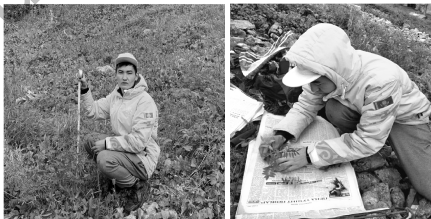
Сурет 2. Морфометрикалық көрсеткіштерді өлшеу және гербарий әзірлеу барысы, 2020 ж.

Антропогендік факторлардың әсерінен қысқарып бара жатқан шай тиынтағының келесідей морфометрикалық көрсеткіштері өлшенді: өсімдік биіктігі, жапырақтың ені мен биіктігі, сабақтың диаметрі мен өсімдіктің жапырақ саны. Hedysarum theinum популяциясына сипаттама берілді.