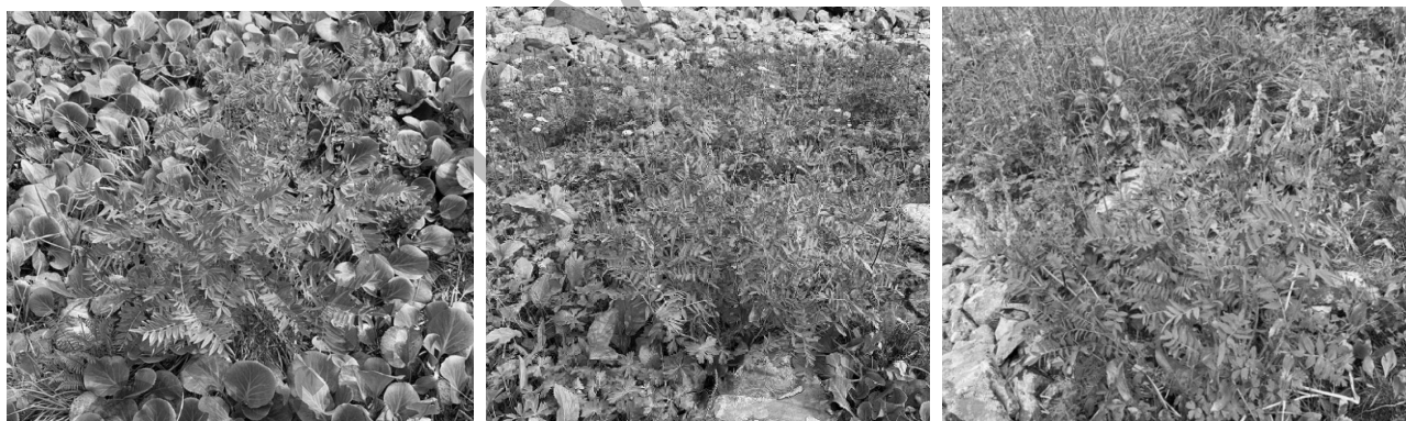
Сурет 3. Hedysarum theinum ценопопуляциялары, 2020 ж.

Pinus sibirica — sol, Larix sibirica — sp, Bergenia crassifolia -cop2, Spiraea trilobata -sol, Spiraea media -sol, Lonicera altaica — sp, Saussurea frolovii -sol, Doronicum altaicum -sp, Plantago major — s.