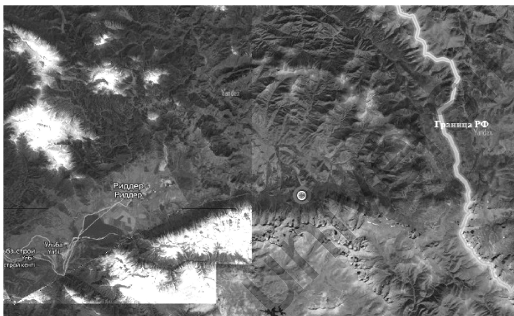
Сурет 1. H. theinum жиналған аймақтың картасы

2020 жылы тамыз айында Шығыс Қазақстанда жиналған H. theinum түріне эко-морфологиялық зерттеулер жүргізілді. Барлаушылық-маршруттық экспедиция нәтижесінде Шығыс Қазақстанның Алтай тауларынан жиналған өсімдіктерге далалық және зертханалық өңдеу жүргізілді, жиналған өсімдіктердің систематикалық сипаттамасы жазылып, түрі анықталды, анықталған түрге гербарий жасалып, морфологиялық ерекшелігі бинокуляр көмегімен зерттелді (сур. 2).