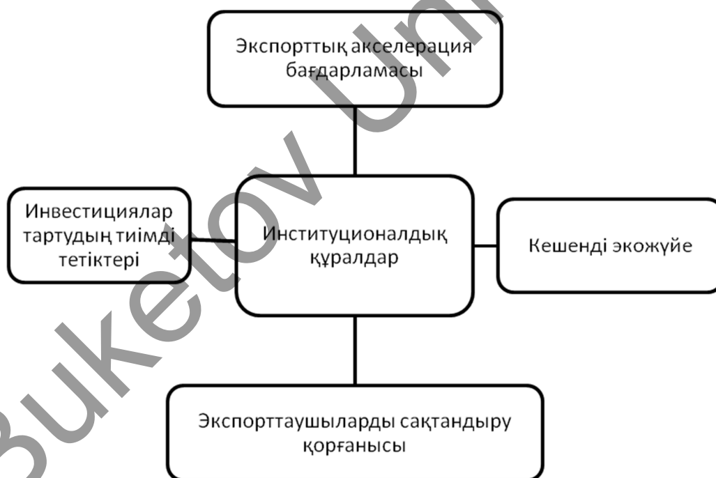
2-сурет. Тоқыма өнеркәсібі өнімдерін экспорттауды дамытудың институционалдық құралдары

Тоқыма өнеркәсібінде қалыптасқан мәселелерді шешуді институционалдық құралдарға сүйене отырып жүзеге асырған жөн. Бұл құралдарға экспорттық акселерация бағдарламасы, кешенді экожүйе, экспорттаушыларды сақтандыру қорғанысы, инвестициялар тартудың тиімді тетіктері жатады (2-сурет).