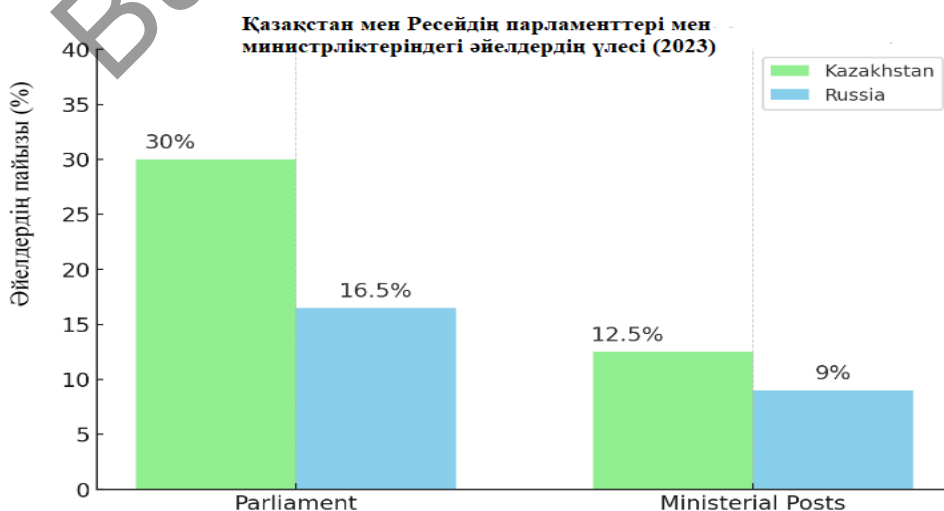
Сурет 3. Қазақстан мен Ресейдің парламенттері мен министрліктеріндегі әйелдердің үлесі

Ресей: 2023 жылғы жағдай бойынша министрлердің 10%-дан азы әйелдер. Әйелдер көбінесе әлеуметтік және білім министрліктерін иеленсе, негізгі экономикалық және қорғаныс қызметтерін негізінен ер адамдар атқарады (3-сурет).