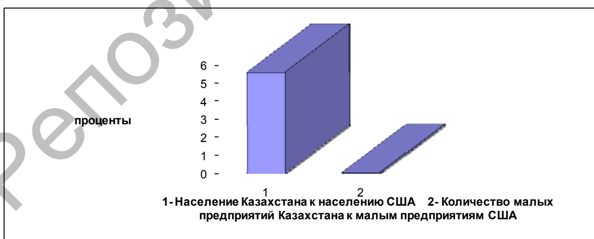
Рисунок 2. Соотношение населения и фактически действующих малых предприятий Казахстана и США

Проблемам развития малого бизнеса уделяется повышенное внимание во всем мире. В последние годы малые предприятия стали привлекать к себе все более пристальное внимание как исследователей, ученых-экономистов, так и политиков в различных странах. Все более широкое признание получает способность предприятий малого бизнеса вносить существенный вклад в решение проблем занятости и повышения конкурентоспособности целых отраслей. В связи с этим усиливается интерес как к изучению малых фирм, особенностей управления малым бизнесом, так и к анализу тенденций состояния данного сектора экономики и формируется потребность в соответствующей информации.