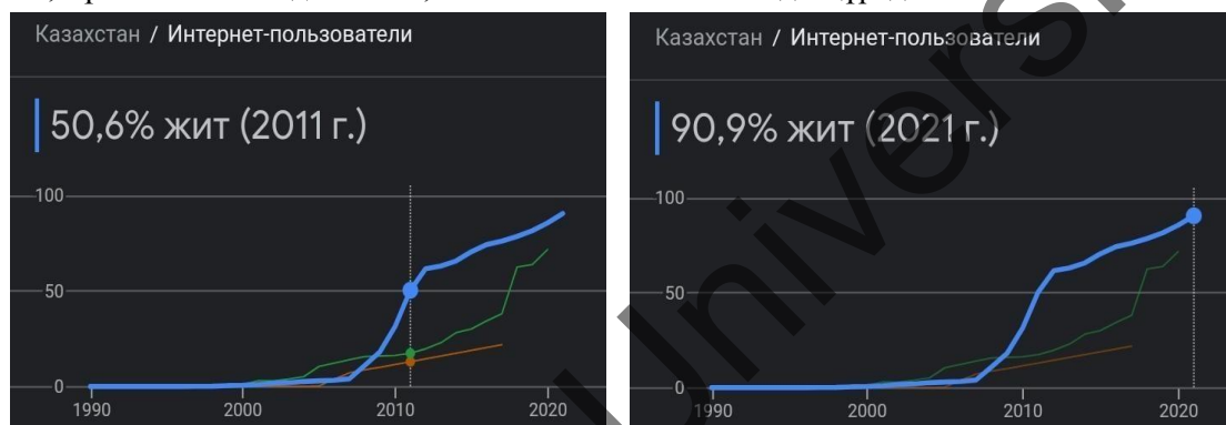
1 сурет - Интернет пайдаланушылардың 2011-2021 жж диаграммасы

Қазіргі таңда елімізде интернет желісін қолданбайтын қазақ қалмады десек қате айтпаймыз. Бұлай айтуыма себеп, 2021 жылы Интернетті белсенді пайдаланушылардың, яғни желіге күн сайын немесе күн сайын дерлік кіретіндердің үлесі 15 жастан асқан жалпы халықтың 76,7%-ын құрады. Бес жыл бұрын халықтың жартысынан сәл астамы, яғни 56,2%-ы белсенді интернет пайдаланушысы болған. Бұл 15 жастан асқан жасөспірімдер мен ересек адамдардың ғана үлесі екенін естен шығармаңыздар. Қазір 3,4 жасар бүлдіршіндердің де қолында жеке ұялы телефондары бар. Естеріңізге сала кетсек 2011 жылы интернет қолданушылар үлесі 50,6% -ды құраса, бұл есеп 10 жылдан кейін, яғни 2021 жылы 90,9% -ды құрады.