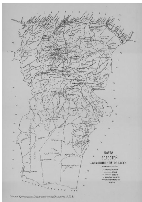
Карта Акмолинской области. 1893 г.