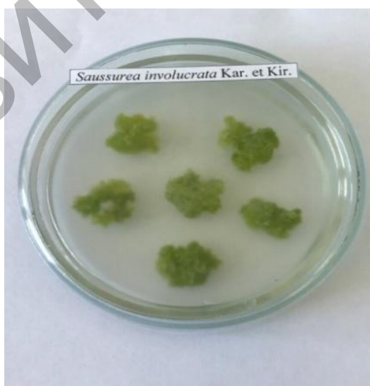
1 сурет - Қатпарлы шұбаршөп калусының ұлпалары

Алынған мәліметтерден белсенді эксплант – 6-БАП 0,5мг/л, ИСК 2 мл/л құрамдас Мурасига мен Скукга модификацияланған қоректік ортада өскен қатпарлы шұбаршөптің стерильді өсінділерінің тұқымжарнақ жапырақтары. Бұл ортада каллусогенез процесі 7 күндік өсіруде байқалады. Қатпарлы шұбаршөптің тұқымжарнақ жапырақтарынан индукционалданған каллус ашық жасыл түс пен борпылдақ консистенциямен сипатталады. Көзбен шолу кезінде құрылымының гомогендігімен ажыратылды (1 сурет).