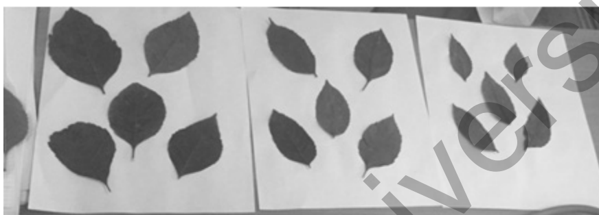
Сурет 1. Морфометриялық зерттеуге және флуориметр арқылы анықтауға алынған жапырақтар үлгілері

Төменде көрсетілген графиктерде орташа арифметикалық мәндері және стандартты орташа кателігі көрсетілген. Фотосинтетикалық аппараттың жұмысының тиімділігін бағалау үшін электронды тасымалдау процесінде фотосистемаларды құрайтын хлорофилл молекулаларының қозғау энергиясы қандай бөлігін пайдаланатынын білу маңызды.