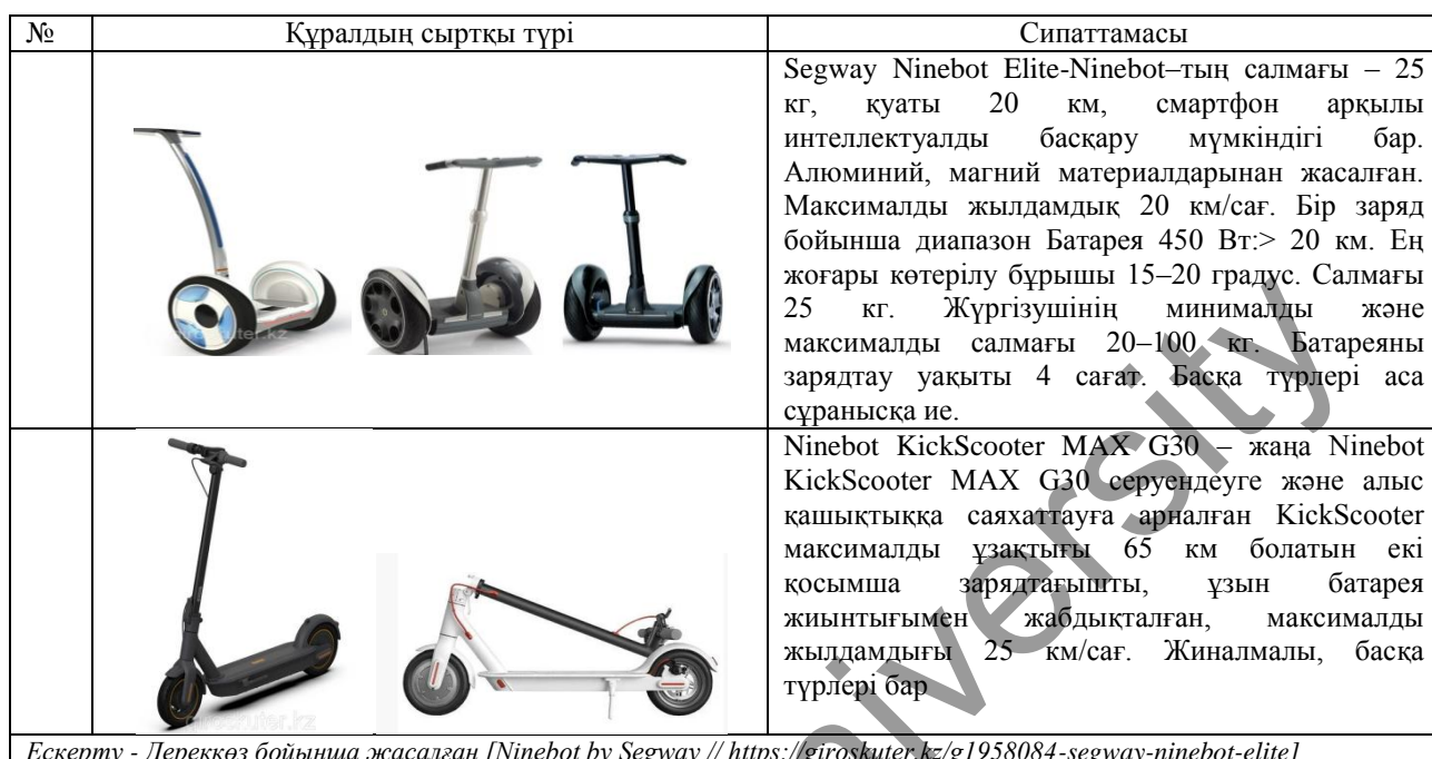
Кесте 1. Segway–дің сыртқы түрі

Жалпы нарықта Segway мен электросамокаттардың бірнеше түрі бар, біз кестеде өзіміз сатып алуға ниеттенген түрлері бойынша талдау жүргізіп отырмыз. Дүкеннің сайтында құралдар бойынша жылы лебіздер берілген, көпшілігіне тауардың сапасы ұнаған.