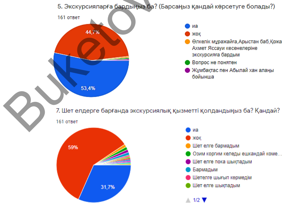
2-сурет. «Отандық және шетелдік экскурсиялық қызметті қолдану» сұрақтарының жауап нәтижелері

Жауап берушілер экскурсиялар туралы білсе де, оларды көпшілігі қолданбаған, 161 адамның 44,7%, яғни 72 адам экскурсияға бармаған және мөлшермен 40% адам, оның 31,7% жоқ деп нақты жауап берсе, 59% шет елдегі экскурсиялық қызметті қолданған және қалған 8% шет елге бармағандығын көрсеткен (2-сурет).