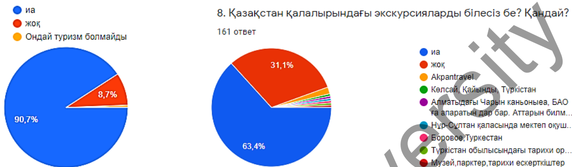
1-сурет. «Қазақстандағы экскурсиялық қызметті білу» сұрақтарының жауап нәтижелері

Негізгі сауалнамаға барлығы 61 адам, 17-18 жас аралығындағы, қыздар, студент жастар жауап берген. Сұрақтар экскурсиялық қызметке байланысты қойылды, соның бірі Қазақстандағы экскурсиялық қызмет туралы білесіз бе? Жауаптардың 90,7% қанағаттарлық жауап берсе, 8,7% білмейтіндігін көрсеткен және соның 69% адам Қазақстанның қалаларындағы ұйымдастырылатын экскурсиялардан хабардар екендігін көрсеткен (1-сурет).