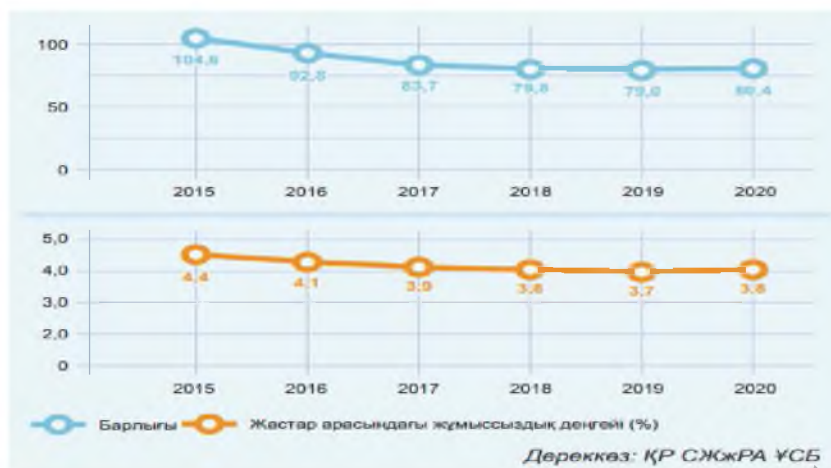
Сурет 2. Жастар арасындағы жұмыссыздық деңгейі (мың адам)

Суретте көрсетілгендей, 2020 жылы елімізде 15–28 жас аралығындағы жұмыссыз жастар саны 80,4 мың адам (бұл алдыңғы жылғыға қарағанда 1,7% артық), ал жастар арасындағы жұмыссыздық деңгейі 3,8% болды. 2021 жылдың екінші тоқсанында бұл көрсеткіш біршама төмендеді (77,5 мың адамға дейін). Соған қарамастан, халықтың осы тобындағы жұмыссыздықтың қазіргі ауқымы ол топтың еңбек нарығындағы тұрақсыз жағдайын көрсетеді. Сонымен қатар, жұмыссыздықтың арта түсуінің себептерінің бірі ол жас жұмыс күшінің ұтқырлығы жұмысқа тұру проблемаларын күшеюде.