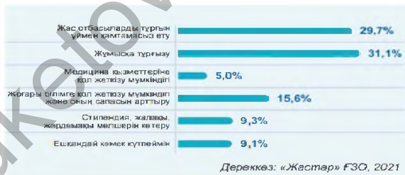
Сурет 1. Жастар саясатындағы маңызды мәселелер

Мемлекеттік жастар саясатын тиімді және сапалы жүзеге асыру үшін қолдау ең алдымен жастардың мәселесін шешу керек. Жастар саясатын қалыптастыру кезінде жастардың қалауы мен сұранысын да ескерген маңызды. Қазақстандық жастардың пікірінше, мемлекеттік жастар саясатын іске асыруда бірінші кезекте жұмысқа тұрғызуға (31,1%), жас отбасыларды тұрғын үймен қамтамасыз етуге (29,7%), сондай-ақ білімге қол жеткізу мүмкіндігі мен оның сапасын арттыру мәселелеріне (15,6%) де назар аудару қажет. Ол 1 суретте көрсетілген.