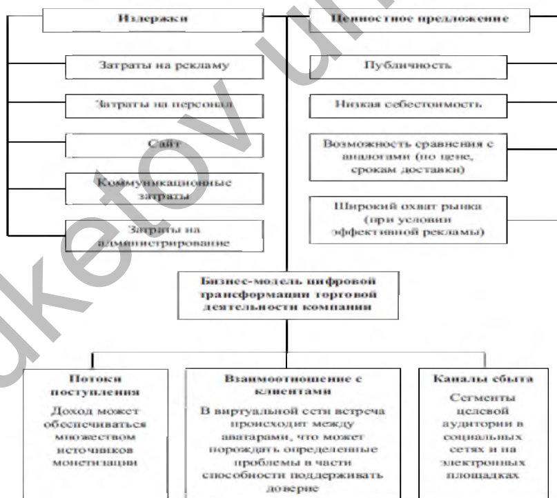
Рисунок 2. Компоненты бизнес-модели электронной торговли в виртуальных сообществах с выделением специфики компонент Примечание - Авторская конструкция

В то же время полноценная реализация цифровой трансформации бизнес-модели компании в рамках комплексного подхода не является доступной для большинства компаний малого и среднего бизнеса в связи со значительными затратами с одной стороны и ограниченностью специалистов на рынке, с другой стороны.