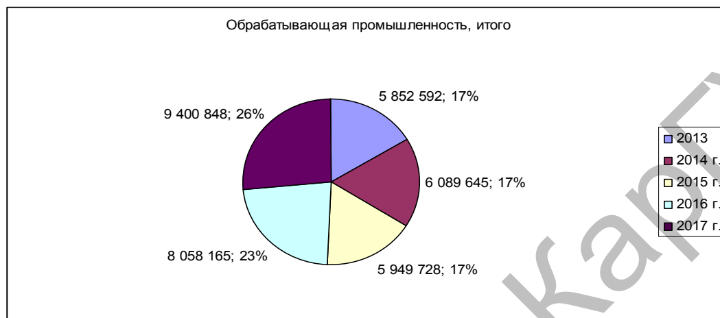
Рисунок 5. Относительные и абсолютные показатели обрабатывающей промышленности за 2013–2017 гг.

Из данных таблицы 2 можно проанализировать пятилетний отчетный период в обрабатывающей промышленности: из индекса физического объема в 2017 г. к уровню 2013 г. видно увеличение производства всех продуктов питания; черная металлургия повысила свое производство в 2 раза — с 636 113 в 2013 г. до 1 535 768 в 2017 г.; металлургическая промышленность увеличилась практически в три раза — с 1 752 059 в 2013 г. до 4 075 747 в 2017 г. Относительные и абсолютные показатели рассмотрены на рисунке 5.