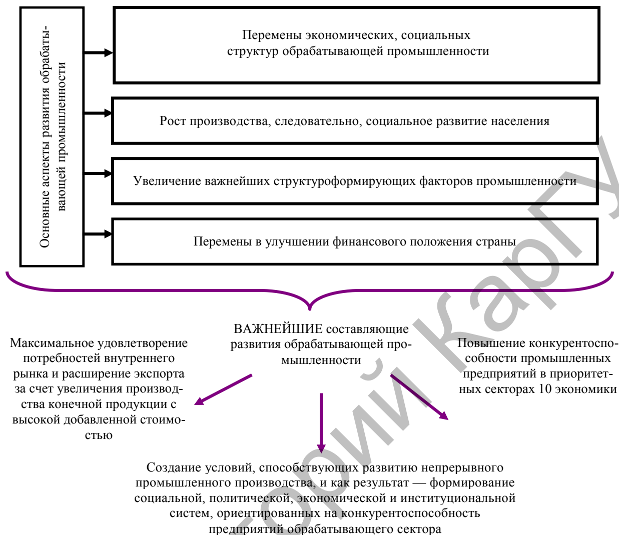
Рисунок 1. Основные аспекты развития обрабатывающей промышленности

Рассмотрев основные аспекты развития обрабатывающей промышленности, можно сделать вывод о том, что создание условий для развития непрерывного промышленного производства будет способствовать улучшению не только общего положения в развитии, но и социальной, политической, экономической, институциональной, инновационно-инвестиционных систем, ориентированных на повышение конкурентоспособности предприятий обрабатывающего сектора.