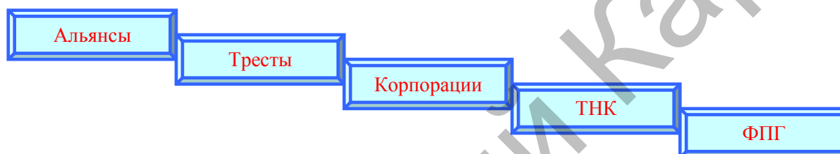
Рисунок 3. Основные типы мировых интегрированных систем

Перейдя к основным формам обрабатывающей промышленности в Республике Казахстан и мировой экономике, можем назвать некоторые основные типы экономических интегрированных систем (рис. 3).