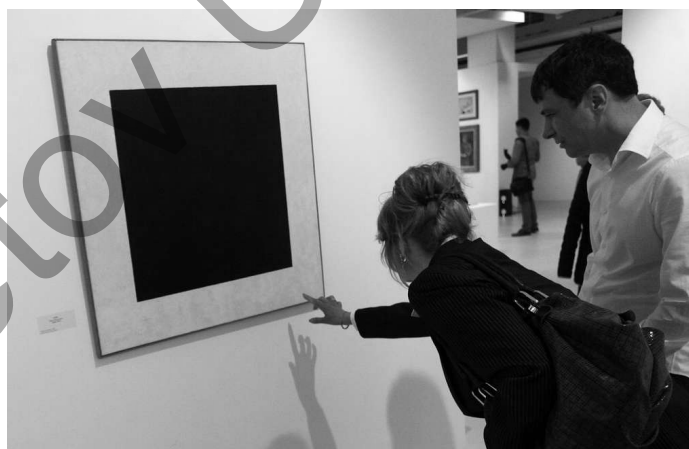
Эксперты изучают «Черный квадрат»