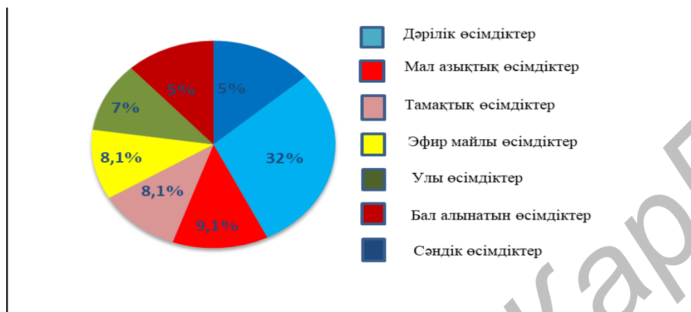
Сурет 2 - Пайдалы өсімдіктердің қолданылуына байланысты жіктелуі.

Alyssum desertorum , көктемдік әжік- Draba nemerosa , көкнар тұқымдасынан, 1 түр: шангин айдаршөбі- Corydalis schangini , кипарис тұқымдасынан, 1 түр: қазақ аршасы – Juniperus Sabina