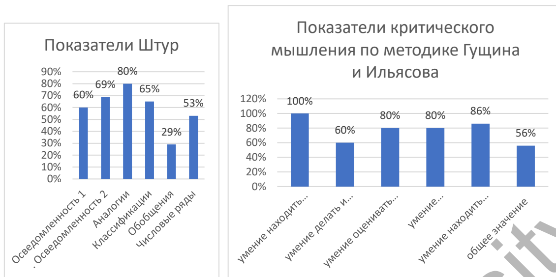
Рис.2 Результаты исследования критического мышления у подростков

Если проанализировать полученные результаты в ракурсе взаимозависимости, то можно, на основании корреляционного анализа и полученных показателей коэффициента Спирмена, сказать, что от информационной осведомленности, умения делать аналогии, классификацию, зависят эмоциональная осведомленность, управление эмоциями, понимание эмоций, межличностный и внутриличностный ЭИ, самомотивация. От умения обобщать и синтезировать, по нашим данным, зависит умение человека распознавать эмоции других. А умение управлять эмоциями зависит от умения действовать и оценивать логические умозаключения. Между этими показателями были обнаружены положительные корреляции. Значение r_s по Спирмену были в пределах от 0,29 до 0,45 ( p < 0,01 ).