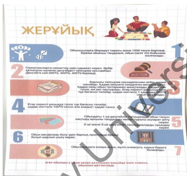
1-сурет. Геймификациялық ойын шарты (Жерұйық)

Ойын барысында топтық жұмыстарды ұйымдастыру арқылы коммуникация дағдыларын дамытуға да ерекше көңіл бөлінді. Білім алушылардың бір-бірімен пікір алмасып, өз ойларын ашық және еркін жеткізуі сабақтың тартымдылығын арттырып, олардың ынтасын оятты. Мұндай оқыту әдісі, бір жағынан, ұлттық педагогиканың негіздерін сақтай отырып, заманауи әдіс-тәсілдерді қолдануға мүмкіндік берді. Сонымен қатар, білім алушыларға ақпаратты тек қана тыңдай отырып емес, оны белсенді түрде өздеріне қажетті формада қолдануға, тәжірибе жүзінде меңгеруге мүмкіндік туды. Осының бәрі оқыту үрдісін қызықты әрі шығармашылыққа толы етті.