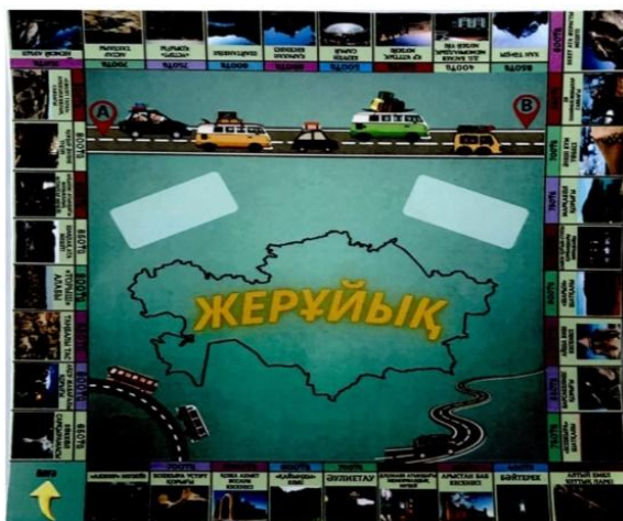
2-сурет. Геймификациялық жерұйық ойынының картасы

Білім алушыларды тек біліммен қаруландырып қана қоймай, олардың жеке дамуында маңызды рөл атқарады, өйткені әрбір дұрыс жауап немесе ұтылған балл келесі тапсырмаға дайындық пен мотивацияны арттырады. Мысалы: Бірінші деңгейден өтуге берілген тапсырма. Ш. Уәлихановтың қазақ жерін зерттеген аймағының карта-схемасын табыңыз. Екінші деңгейден өту тапсырма: карта-схемада көрсетілген нысан атауының ұлттық құндылығы көрсетілген картаны анықтаңыз. Үшінші деңгейден өту тапсырмасы: аталған нысандарды картадан табыңыздар.